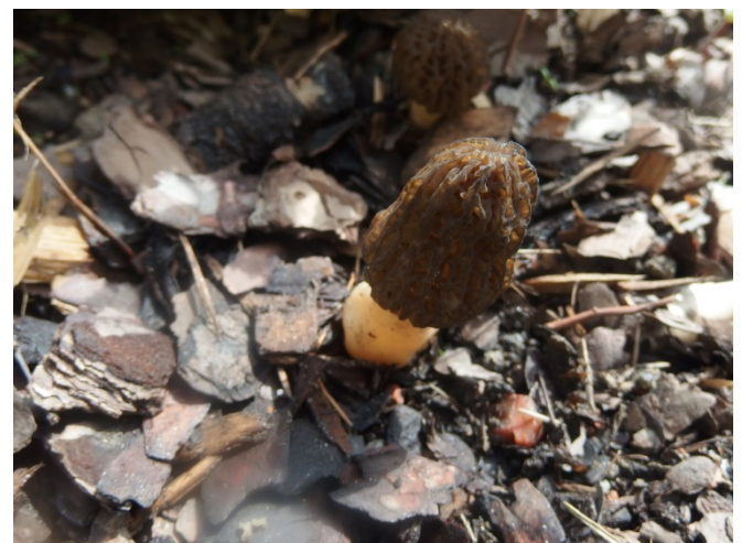
Inger Moqvist, Häggviksvägen 19, fotograferade påpassligt en perfekt toppmurkleskönhet!