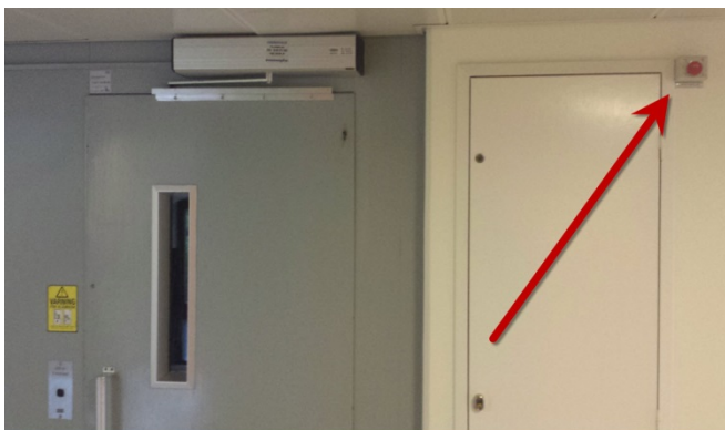
Nödstoppknappen kan ses vid pilen, till höger om hissdörren, på bottenvåningen.

Du nödstoppar husets ventilation enkelt genom att trycka på den röda nödstoppknappen som finns på trapphusens bottenvåning invid hissen strax under taket.