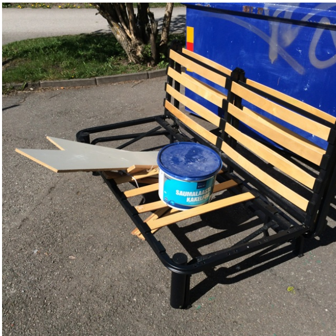
Otillåtna sopor utan för containern vid tennisbanan.

Den är inte avsedd för återvinningsprodukter, elartiklar, rivningsavfall eller miljöfarlig avfall. Containern är låst – samma svarta nyckel som går till källaren passar i hänglåset.