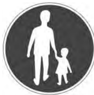
Trafikskylt (blå) för gångbana