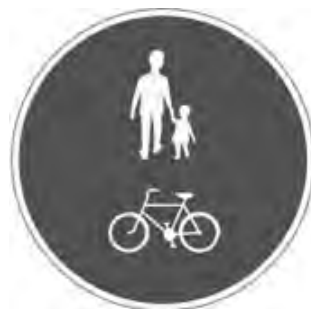
Trafikskylt (blå) för kombinerad gång- och cykelbana