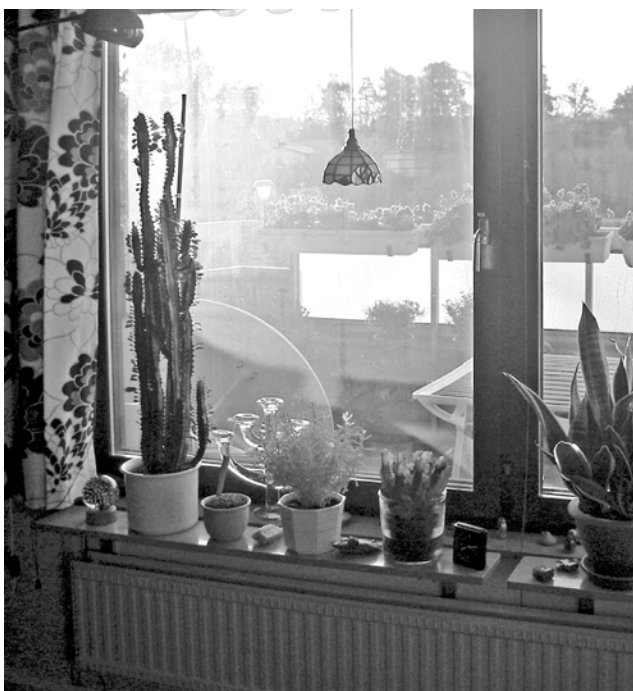
Fönster som inte längre blir rent ...

Några av medlemmarna måste ta på sig större ansvar, vilket det är att arbeta som styrelsemedlem. Att på årsstämman välja en bra styrelse är den bästa - för att inte säga den enda - garantin för att husen förvaltas på bästa sätt.